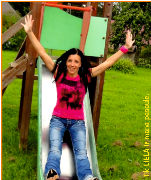
Tik LIELA ir mana pasaule.

Cilvēkam vienmēr ir jātiecas uz arvien jauniem, izvirzītiem mērķiem. Galvenais nosacījums ir - neapstāties, nepadoties to realizēšanā. Šobrīd mans mērķis ir veiksmīgi pabeigt studijas pedagoģijā. Un tad atkal izvirzīt jaunus mērķus. Pieļauju domu, ka nākotnē pievērsīšos arī žurnālistikas studijām. Dzīves ceļš ir līkumains. Kas zina, kas mūs sagaida aiz katra līkuma. Māņticīgie? Esmu starp tiem. Par sapņiem nedrīkstot skaļi runāt, jo tad tie nepiepildoties. Bet ir man kāds sapnis - ĻOOOOOTI, ĻOTI LIELS. Kad to būšu piepildījusi, noteikti par to Jums pačukstēšu! Sarunāts?!